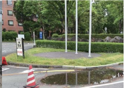
ロータリーの陥没