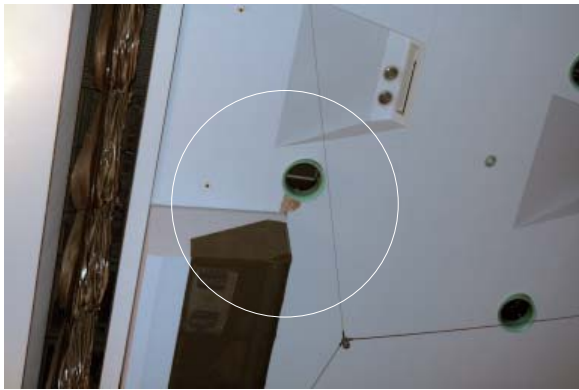
スピーカの揺れにより天井剥離