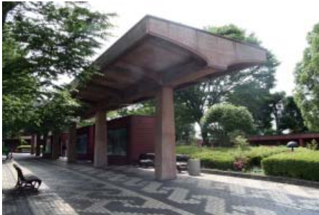
プロムナードの柱の数本に亀裂