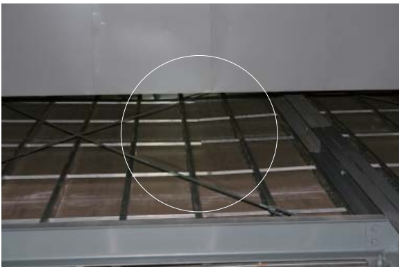
ホリ裏 フレーム損傷