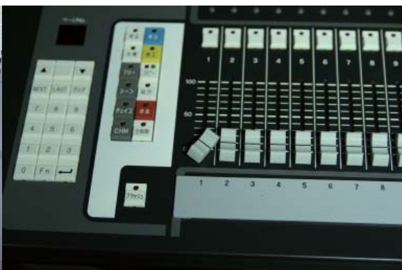
調光卓のフェーダーが落下物により損傷