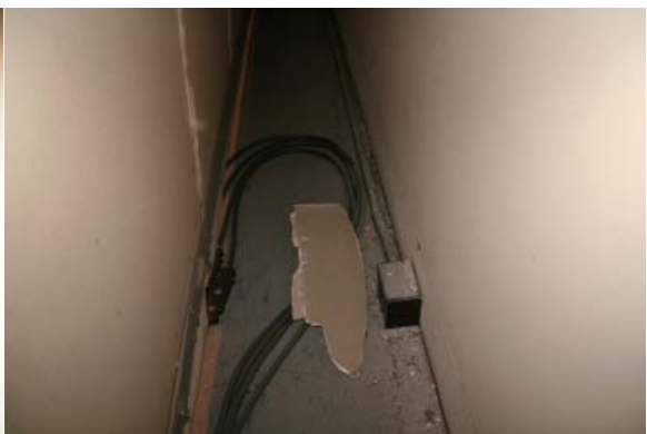
水平幕 裏壁の石膏ボード破片