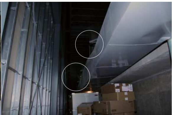
ホリ裏 空調ダクト吊ボルト断裂