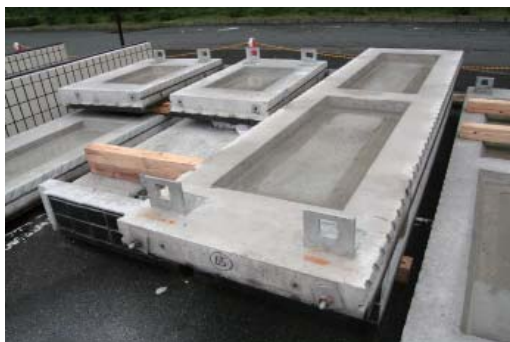
PC 板 上部取り付け部分