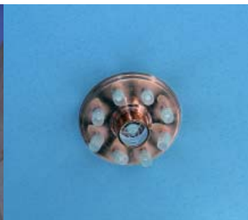
ガラスグローブの傾き