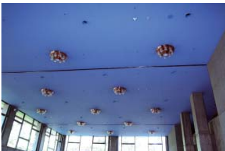
点灯しない電球が多くみられる