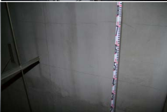
絞り緞帳裏 隔壁一面に亀裂