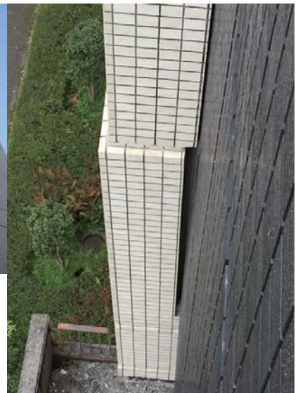
北側 (横から) ズレあり