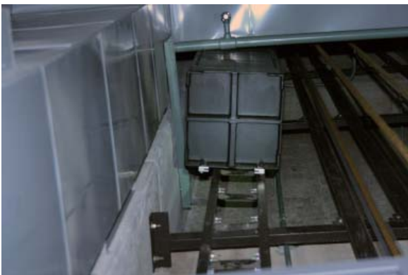
第2ブリッジ(3サス) シズ枠ガイドレール脱線