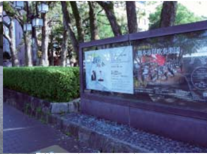
県道側の掲示板のガラス破損