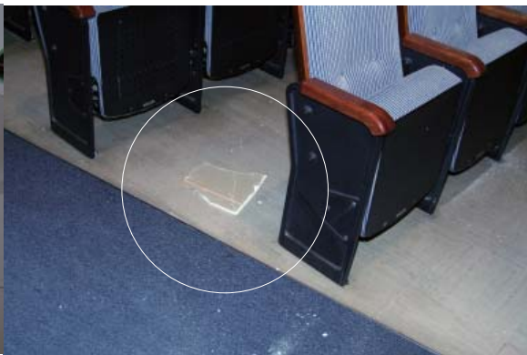
剥離落下した天井ボード