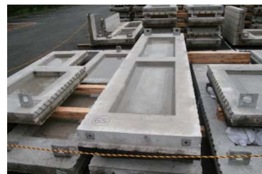
PC 板 下部取り付け部分