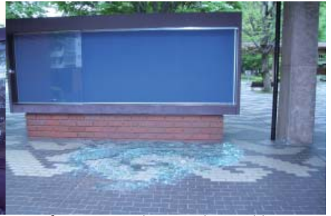
プロムナード掲示板ガラス破損