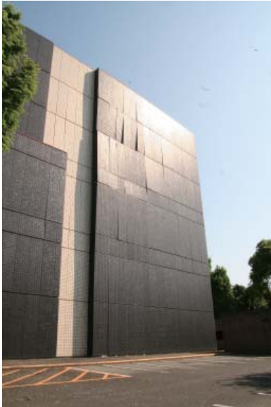
南側 PC 板全体に浮き沈みあり