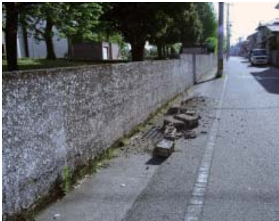
南側外構のブロック落下