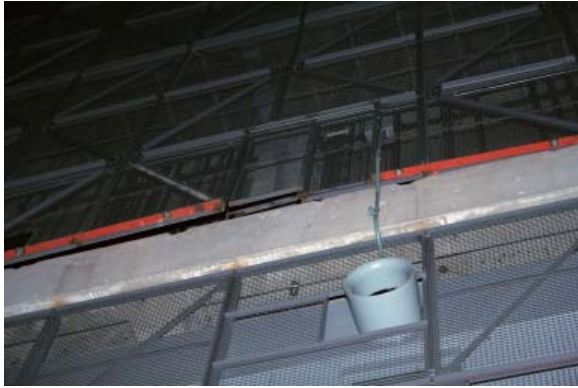
上手綱元フェンス損傷