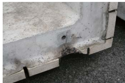
下部取り付け部分 タイルの割れ